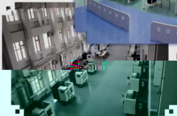
DMG 数控技术训练场所